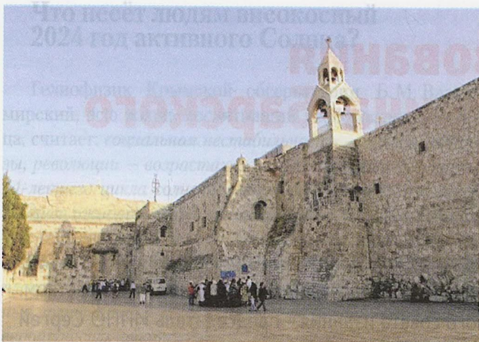
Базилика Рождества Христова в Вифлееме (год основания 320).