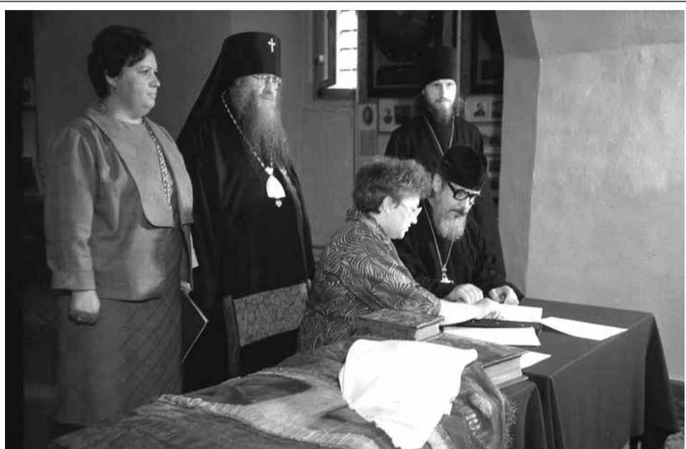
Подписание договора о передаче Рязанской епархии святынь из музея Рязанского кремля.