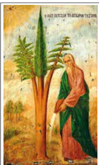
Икона «Лот поливает Древо Креста»

монастырь на горе – хорошая стратегическая высота. В 1948 году ее заняли израильские военные во время арабо-израильского конфликта. В итоге – и солдаты заодно пограбили монастырь, и арабы обстреляли... Увы! Воспоминание о радостном событии Сретения перемежается теперь в этом мо-