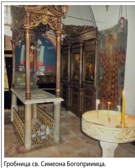
Гробница св. Симеона Богоприимца.

настыре с нерадостными воспоминаниями о человеческих страданиях. Так и в истории со святым Симеоном. Ведь праведный старец при встрече предсказал Матери Божией страдания Ее и Ее Сына – «Тебе Самой оружие пройдет душу».