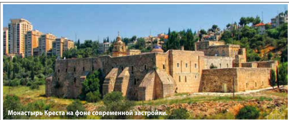
Монастырь Креста на фоне современной застройки.

15 февраля мы празднуем Сретение Господне. Произошла встреча Богомладенца Христа с праведным старцем Симеоном – это знают почти все православные христиане. А вот где в Иерусалиме место, связанное со старцем Симеоном – знают, пожалуй, немногие.