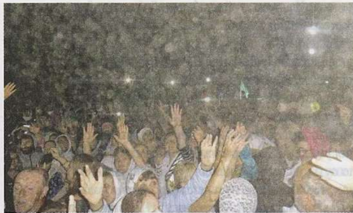
Схождение Благодатного Облака в праздник Преображения Господня с 18 на 19 августа 2018 года