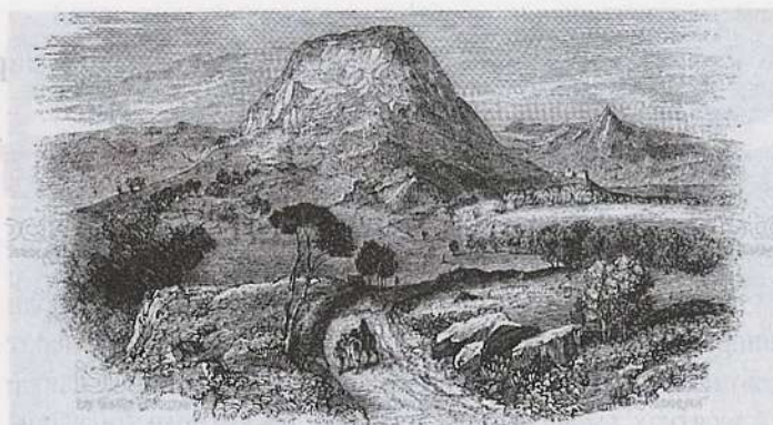
Старинный рисунок горы Фавор

положен на запад от Фавора. И опять, во второй раз, вошли мы с любовью в ту святую пещеру и поклонились святой той трапезе, которую создал Мелхиседек, будучи с Авраамом. И стоит до сего дня трапеза та в пещере. И ныне приходит туда часто святой Мелхиседек и служит литургию в пещере той святой. Мы же поклонились и сошли с горы Фаворской вниз на поле и пошли к Назарету. Расстояние от Фаворской горы до Назарета пять вёрст: по полю две версты, а три в горах; путь весьма тяжёл и очень трудно проходим, ибо много поганых сарацин сидит в горах тех, а по полю тому сёл много сарацинских, из которых выйдут сарацины и убивают странников в тех страшных горах. Опасно было идти с малым числом спутников тем путём, только с большим отрядом можно было бы пройти путём тем без страха. У нас же не оказалось отряда, и мы сами, одни – а всего-то нас было восемь безоружных, на Бога надеющихся, всё же прошли без пакости. Божией благодатью хранимые, дошли мы до святого города Назарета.