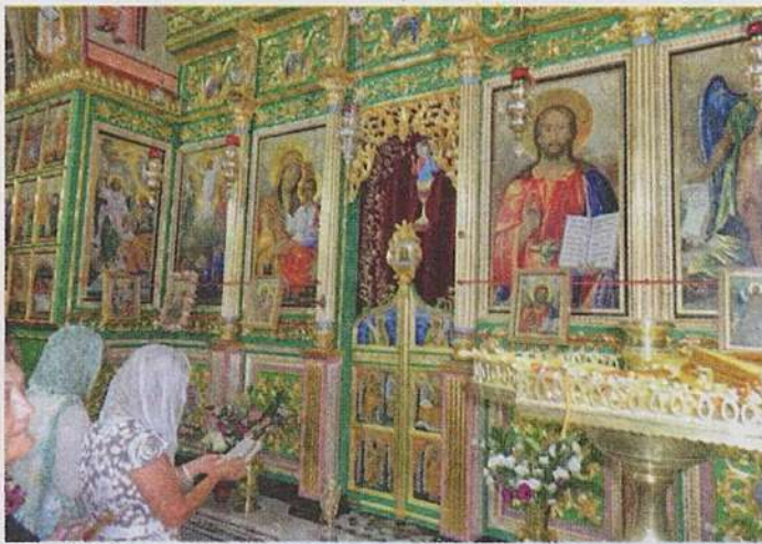
Гора Фавор. Преображенский православный женский монастырь, церковь Спаса Преображения. Алтарь. Паломничество Кипрского отделения ИППО, 2018

Фаворская гора и Назарет от Тивериадского моря на запад; пятьдесят вёрст больших до Фаворской горы. Гора же Фаворская чудесное и удивительное творение Бога: поставлена великолепно, и высока очень, стоит среди поля красиво, как стог круглый, отлично от гор других. Возле горы же течёт река по полю. И выросли по всей