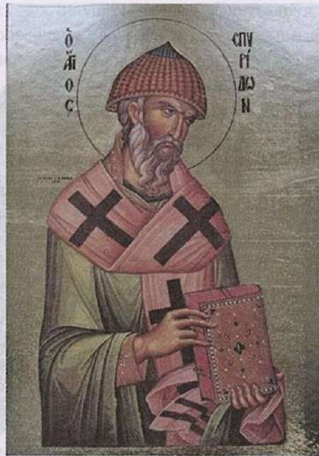
Святой Спиридон. Монастырь Ставровуни, Кипр. Икона приобретена Кипрским отделением ИППО

И вот однажды, через несколько дней, протопоп, собрав у себя все ключи, после святой литургии призвал нас в алтарь и затворил все двери; потом повёл он нас на правую сторону святого алтаря, где покоятся мощи святого, и открыл все четыре замка, которыми заперт его гроб; в этом гробе содержится ещё один, иссечённый из камня, а внутри него – рака, сделанная из кипарисового дерева, покрытая плитой из чистого хрусталя; её же небольшая