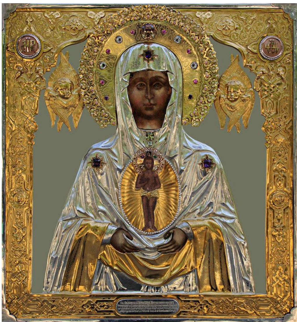
Албазинская чудотворная икона Божией Матери

Албазинской «Слово плоть бысть» иконой Божией Матери (известна также под названием «Хранительница реки Амур»). В сентябре 1900 г. был уволен на покой и поселился в Алатырском Троицком монастыре.