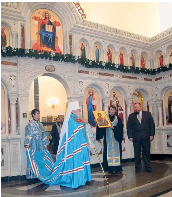
Икона св. блгв. вел. кн. Александра Невского в дар собору в Краснодаре