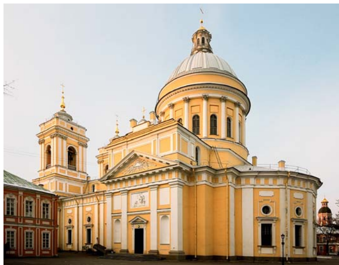
Свято-Троицкий собор Александро-Невской Лавры

Нам довелось, будучи сопредседателями экспертно-редакционного совета на соискание Высшей Российской общественной награды ордена св. блгв. князя Александра Невского